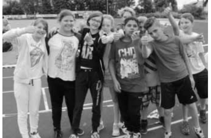
Sport macht Spaß: Schüler/innen der Klasse 6 bei den Bundesjugendspielen

Es war wettermäßig der beste Tag der letzten Wochen. Bei hervorragenden äußeren Bedingungen und angenehmen 23°C fanden am 09.07.2015 die gemeinsamen Bundesjugendspiele der Grundschule Vogt und der Klassen 5-7 der GMS Waldburg-Vogt statt.