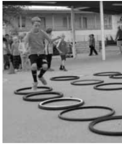
Volle Konzentration und voller Einsatz beim Froschspringen und beim Fensterwurf.