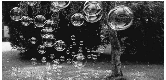
Alexa, Pixabay, Gutenachtkirche

Wir freuen uns auf euch! Euer Kindergottesdienst-Team